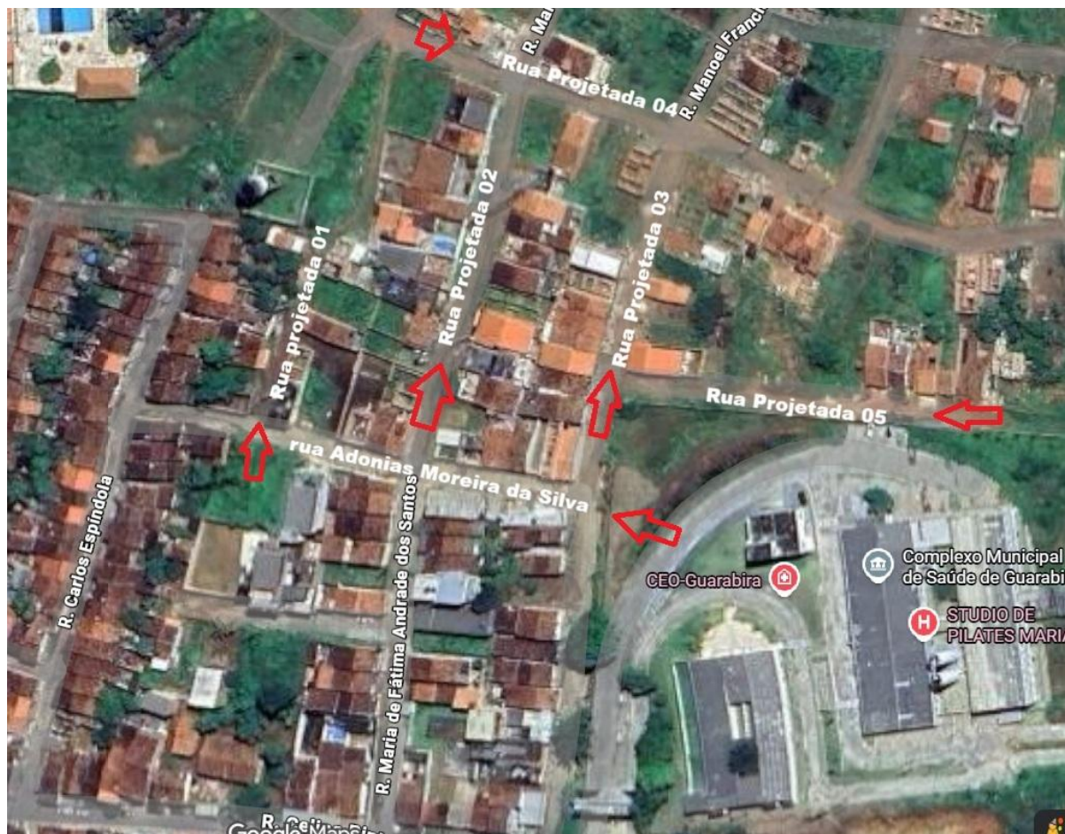
Figura 1: Localização geográfica e delimitação da Rua José Trajano (antiga Rua Projetada 01).